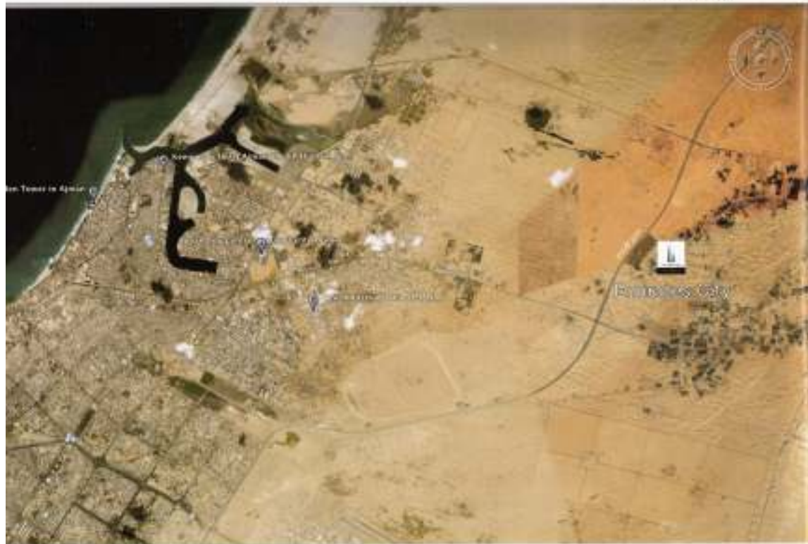
Ajman City Map